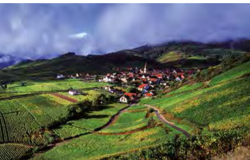
Niedermorschwihr, Bilderbuchdorf in den Nordvogesen

Auf der anderen Seite des Rheins gilt der Schwarzwald als eine der ältesten und schönsten Ferienregionen Deutschlands, die für Tourenfahrer auf zwei und vier Rädern wie geschaffen erscheint. Deutschlands größtes zusammenhän-