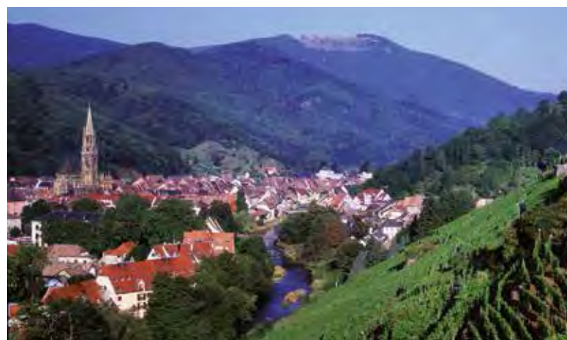
Thann, das südliche Tor der Elsassischen Weinstraße

gendes Mittelgebirge liegt im Westen Baden-Württembergs und erstreckt sich als dicht bebauter Bergkamm auf einer Länge von über 160 km zwischen Pforzheim und Basel in Nord-Süd-Richtung. Von den aussichtsreichen Höhenzügen des Nordschwarzwalds führen mehrere Themenstraßen wie die Schwarzwald-Hochstraße oder die Täler- und die Bä-